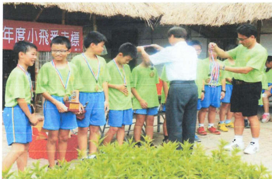
115 年西拉雅族蕭壠社平埔小飛番走向(標)競技比賽活動簡章時程表